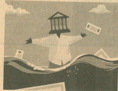
ILLUSTRATION: BINAY SINHA

Given that PSBs account for 90% of the shortfall, the plan would reveal some well-capitalised su